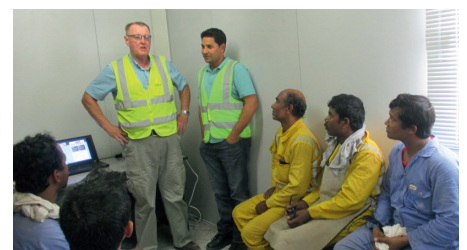
NINA training in Qatar

echtgenoot en vader die na het werk veilig weer naar huis wil. We kunnen ingesleten patronen niet in één workshop veranderen. Maar ik merk wel dat de sfeer verandert naar meer open en interactief. We zetten hier echt een stap!"