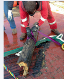
Voorbeeld van loos alarm: mogelijke torpedo blijkt een stuk hout