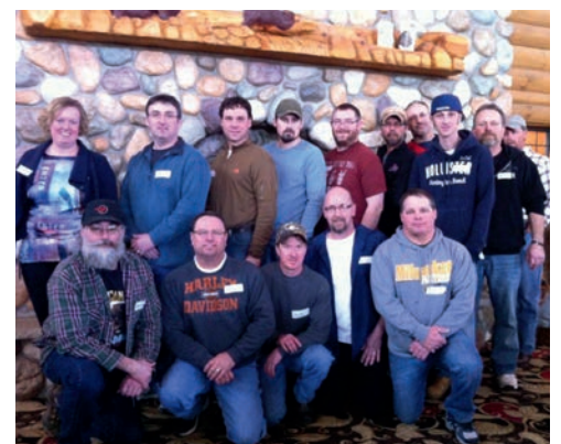
| NINA Experience Fox River Clean Up project