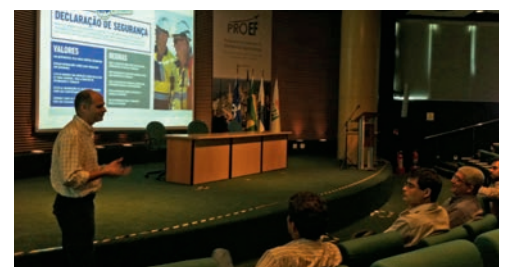
| Apresentação NINA na Petrobras

Futuro: levar o programa NINA ainda mais perto das pessoas, portanto, ainda mais dirigida à prática!