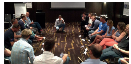
I NINA Training Perth

je aan het denken over jezelf. Ik heb er vier gehad en elke training was leerzaam omdat de groep anders was en er andere ervaringen werden gedeeld. NINA is voor 90% communicatie: elkaar weten te vinden, zaken afstemmen. Ik kan vanachter mijn bureau niet alles bedenken, dus als ik de superintendent op site kan bellen hoeveel mensen hij nodig heeft, helpt mij dat. Het werk wordt er veiliger en beter van.”