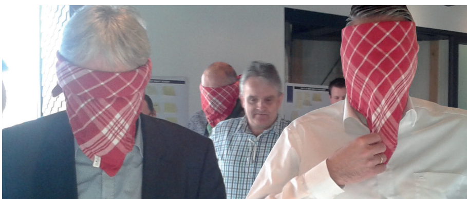
‘NINA Experience’ con los ojos vendados

cómo pudieron suceder.” Lo comprendimos gracias a una venda de ojos, nos cuenta. “Nos asignaron una tarea de simulación, en la cual una parte del grupo tenía que ejecutar instrucciones con los ojos vendados. Es decir, tenías que prestar atención y seguir las instrucciones. Las seguimos a rajatabla. También yo. Y ninguna vez me pregunté por qué lo tenía que hacer de esa manera o si esa forma de trabajar era segura. Más tarde nos dimos cuenta de que muchas veces esto también sucede en situaciones de trabajo: los empleados hacen lo que se les pide y parten ciegamente del supuesto de que ya se han tenido en cuenta los riesgos y la seguridad. Pero en realidad queremos que los empleados sí planteen este tipo de preguntas. Para ello vamos a organizar sesiones especiales NINA. Esta idea detrás de NINA Experience es muy fuerte: ¡realmente nos ha abierto los ojos!”