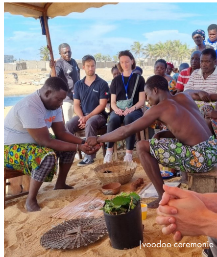
| voodoo ceremonie