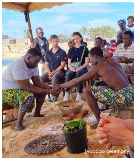
| voodoo ceremony

этому. По его словам, такой подход сложился еще на этапе подготовки контракта. «Сначала мы собирались проводить работы сразу на всей протяженности береговой линии (50 км). Однако это привело бы к серьезным последствиям для рыбаков. Поэтому я предложил разделить участок на части, чтобы рыбаки могли продолжать свою работу. В результате в контракт были внесены соответствующие изменения». По словам Франса, такой шаг оказался верным: «Во время радиопередачи, посвященной проекту, один из слушателей задал мне именно этот вопрос: не лишим ли мы их куска хлеба. Я смог успокоить его и объяснить, как мы будем работать и почему».