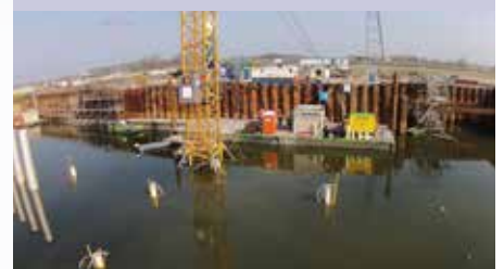
| Overzicht ondergelopen aquaduct Muiden

In het SAAone-project wordt een groot aquaduct aangelegd. Voor de fundering werd de bodem geïnjecteerd met grout om een waterdichte laag te creëren. Deze bleek niet afdoende te werken: het aquaduct in aanbouw kwam onder water te staan. Mét daarin alle equipment, zoals kranen, containers en stellingen. Hierop werden duikers ingeschakeld om obstakels te demonteren en weg te halen, onder water een betonnen vloer te storten en te assisteren met het opnieuw injecteren van de onderlaag.