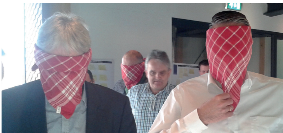
« Expérience NINA » les yeux bandés

nous l'avons compris grâce à une partie de colin-maillard », a-t-il expliqué. « Nous avons effectué une tâche de simulation où une partie du groupe devait effectuer des ouvrages avec les yeux bandés. Il fallait donc bien écouter et suivre les instructions, ce que nous avons bien fait. Moi aussi. Et pas une seule fois, je ne me suis demandé pourquoi il me fallait agir ainsi et si cette approche était sûre. À la fin, nous avons observé qu'il en est souvent ainsi au cours de situations de travail : les employés suivent les instructions et croient aveuglément que l'on aura certainement pensé aux risques et à la sécurité. Mais de fait, voilà ce que nous voulons : que les employés posent cette sorte de questions. Nous allons organiser des sessions spéciales NINA à cet effet. Cette conception de l'Expérience NINA était très puissante : elle nous a littéralement secoués ! »